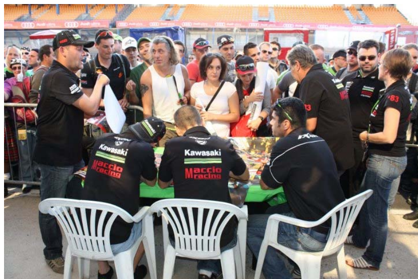
Les pilotes en pleine séance dédicasse

Et avant le départ les spectateurs peuvent venir rencontrer les pilotes, une ambiance très agitée digne de l'empire de la course !