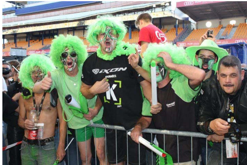
Le fan club est présent !